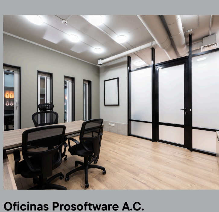
Oficinas Prosoftware A.C. Proyecto en exterior e interior. Fachada integral en cristal claro con película de seguridad turgsteno canceleria en cristal templado, puertas de acceso y canceleria interior.