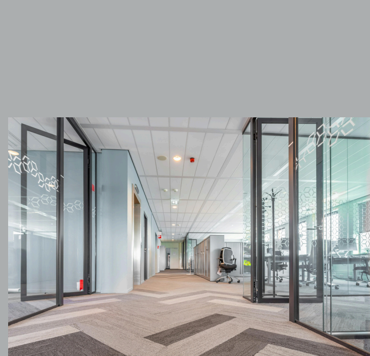
Consejo Empresarial Mexicano de comercio exterior inversion y tecnología A.C. Proyecto en exterior e interior. Cristal para fachada, puertas de acceso y canceleria en aluminio lacado blanco y cristazul.