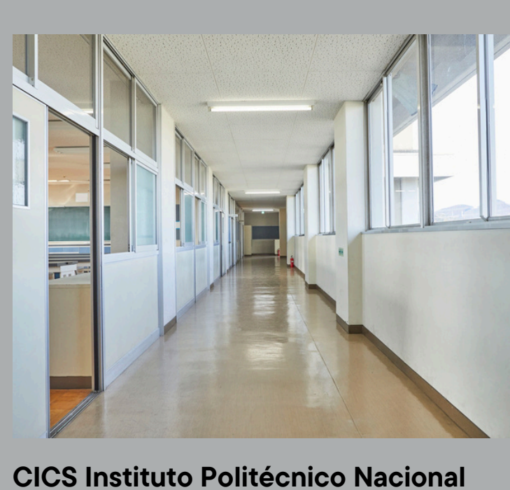
CICS Instituto Politécnico Nacional Proyecto en interior. Canceleria en aluminio anodizado duranodik en acceso y atención.