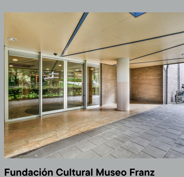
Fundación Cultural Museo Franz Mayer Proyecto en interior. Puertas de acceso en cristal templado y canceleria en aluminio y acrílico opalino.